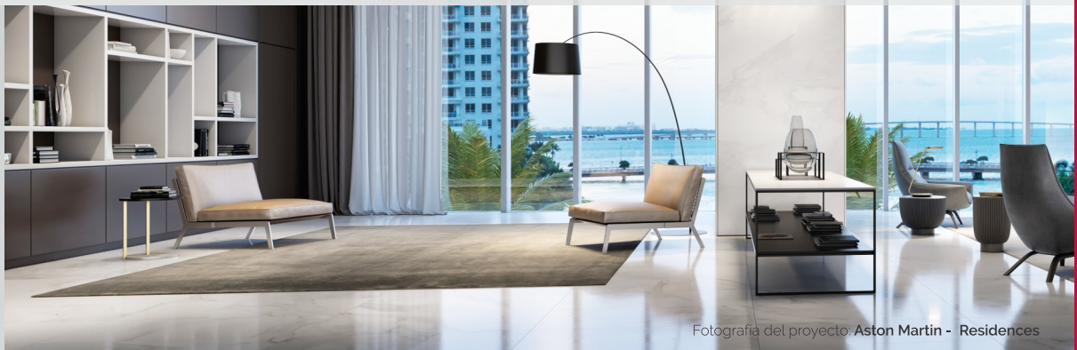
Fotografía del proyecto: Aston Martin - Residences