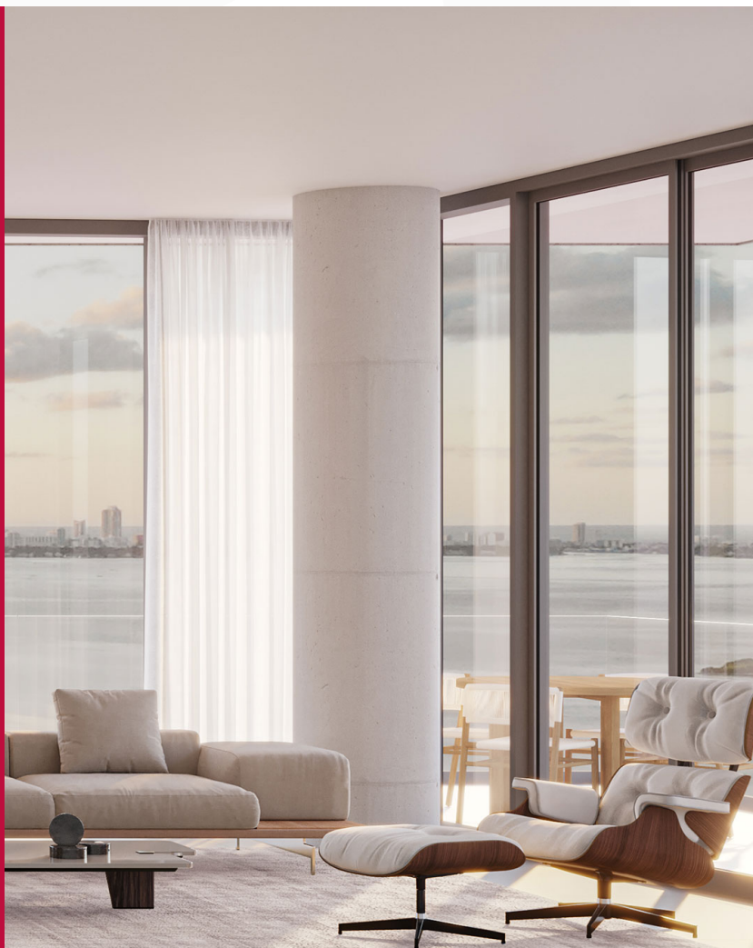
Fotografía del proyecto: Cove Miami