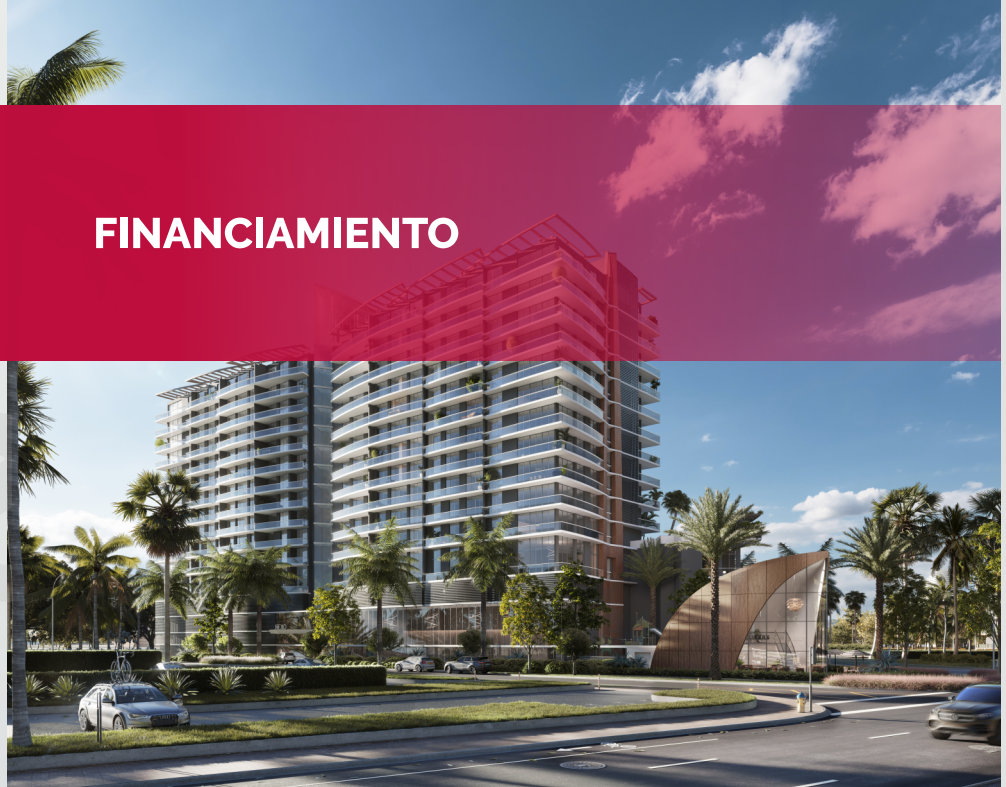
Fotografía del proyecto: Nexo