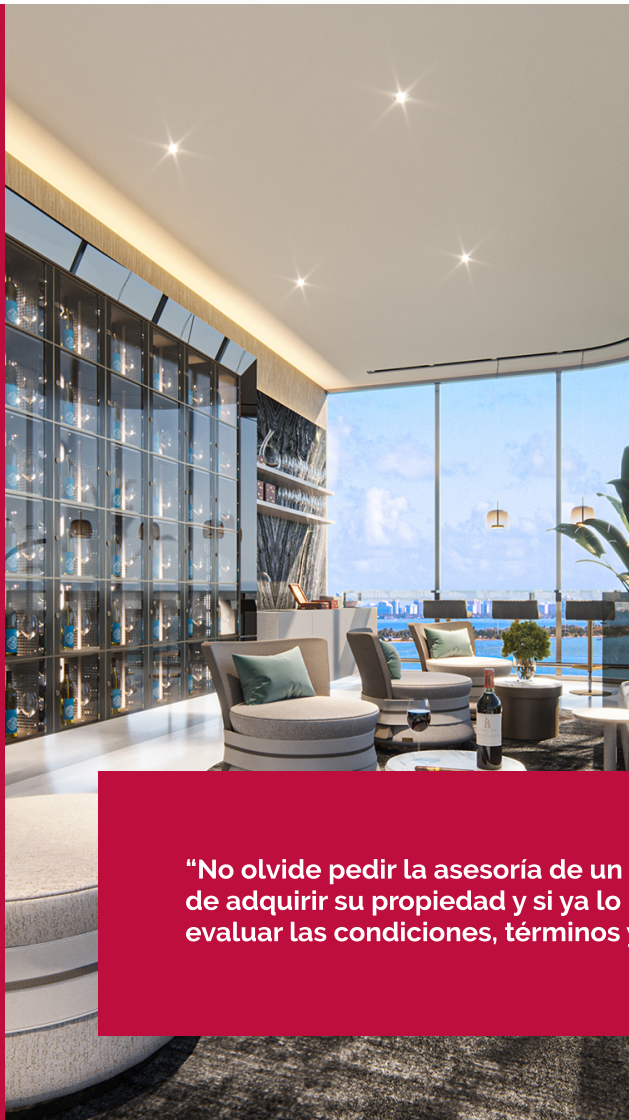
Fotografía del proyecto: Aria Reserve

“No olvide pedir la asesoría de un agente de seguro al momento de adquirir su propiedad y si ya lo hizo, nunca es tarde para evaluar las condiciones, términos y cobertura de su póliza”.