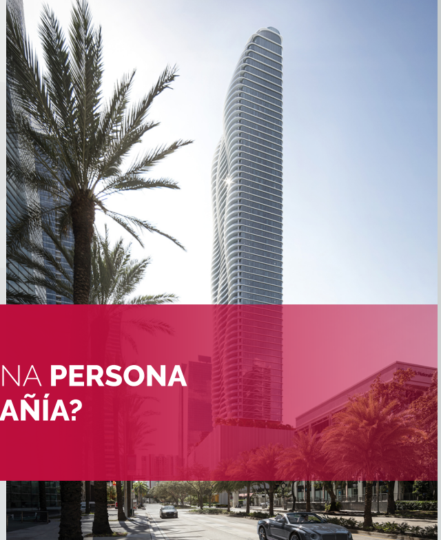
Fotografía del proyecto: 1428 Brickell